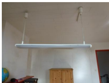
bureaulamp (hangend) en bureau